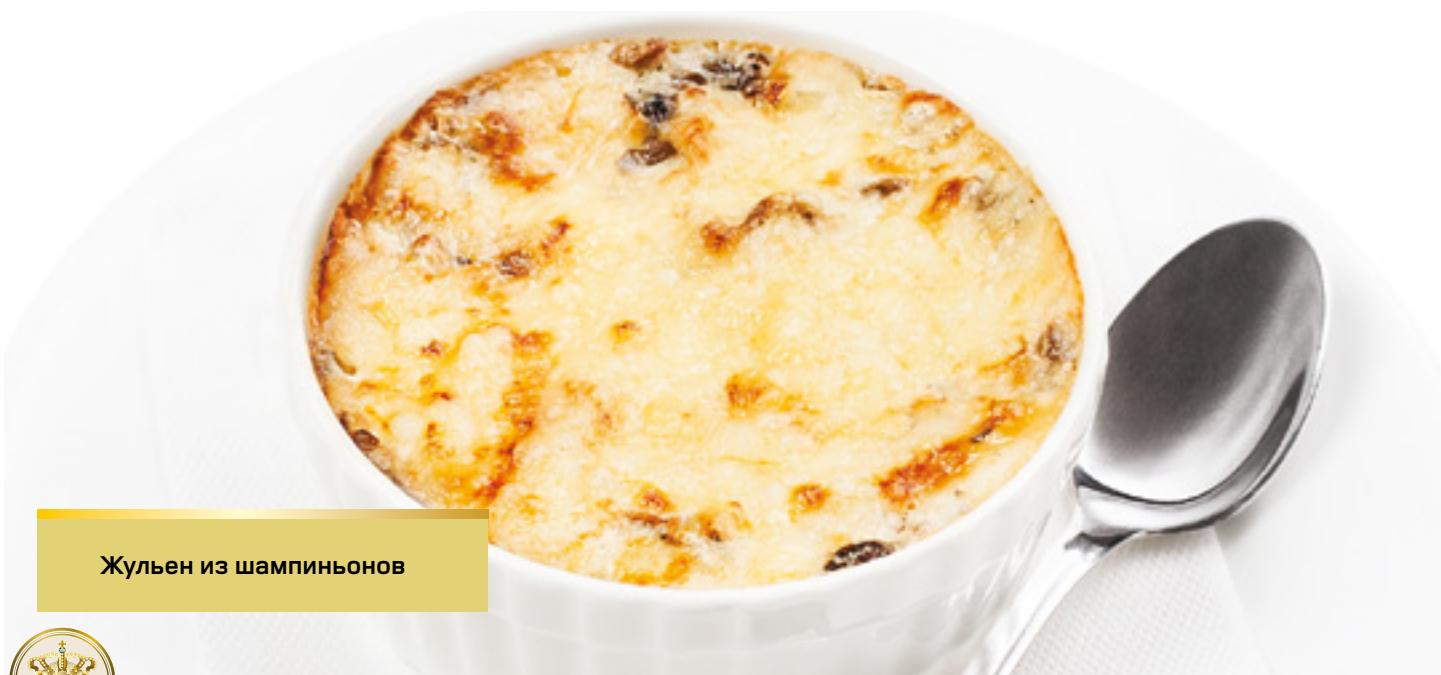
Жульен из шампиньонов