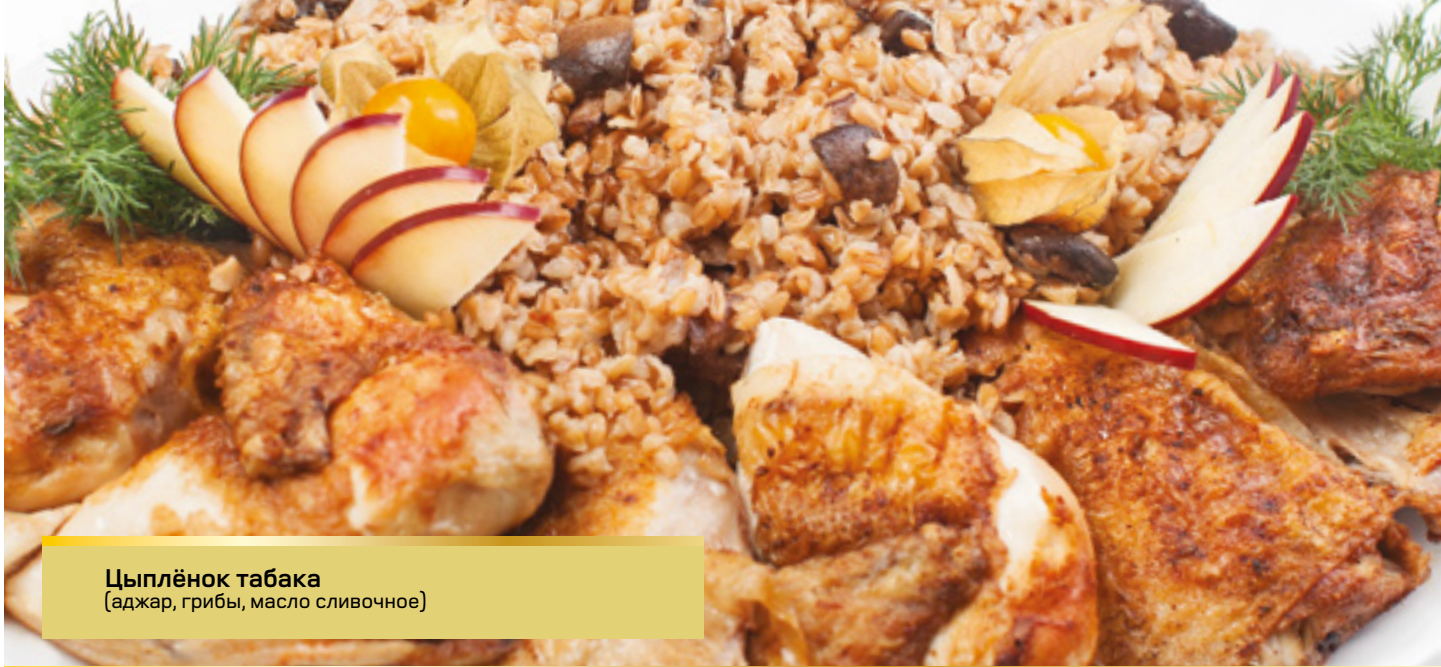
Цыплёнок табака (аджар, грибы, масло сливочное)