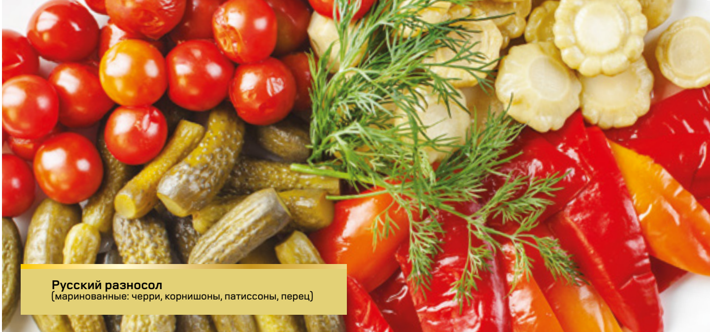
Русский разносол (маринованные: черри, корнишоны, патиссоны, перец)