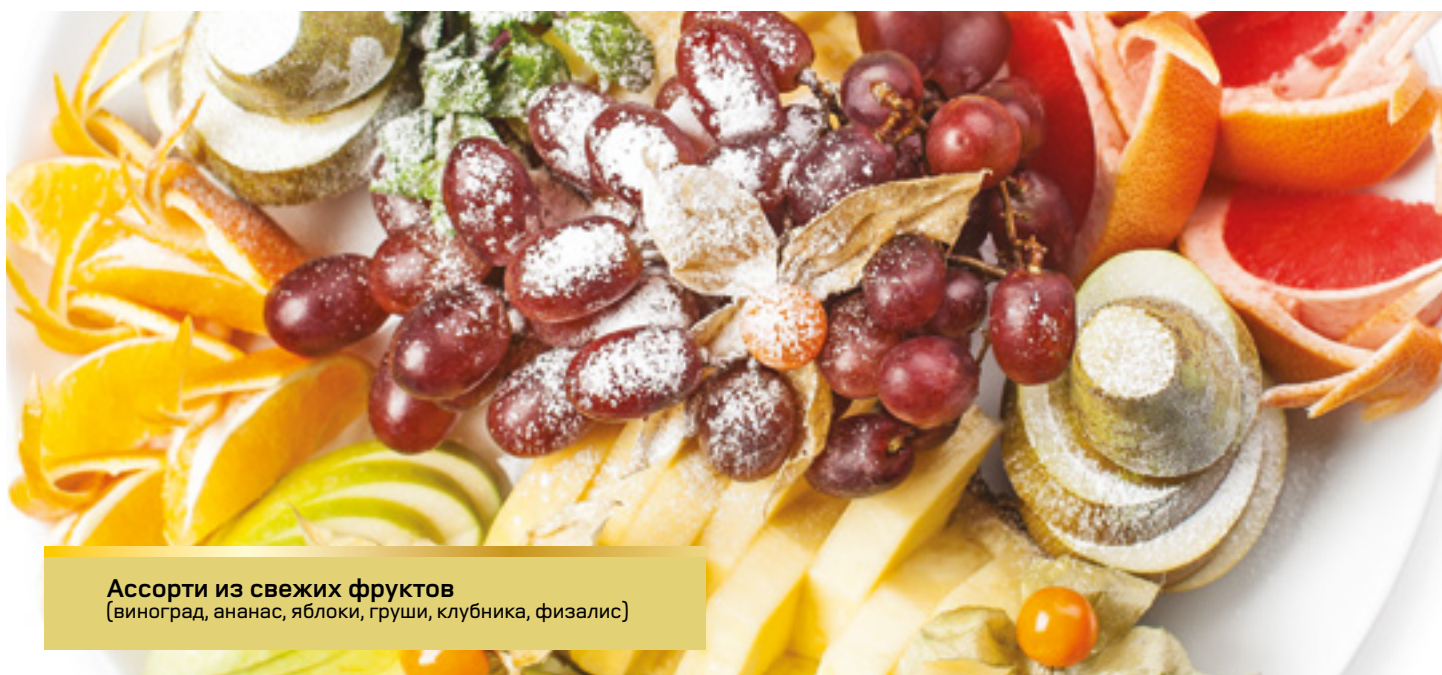
Ассорти из свежих фруктов (виноград, ананас, яблоки, груши, клубника, физалис)