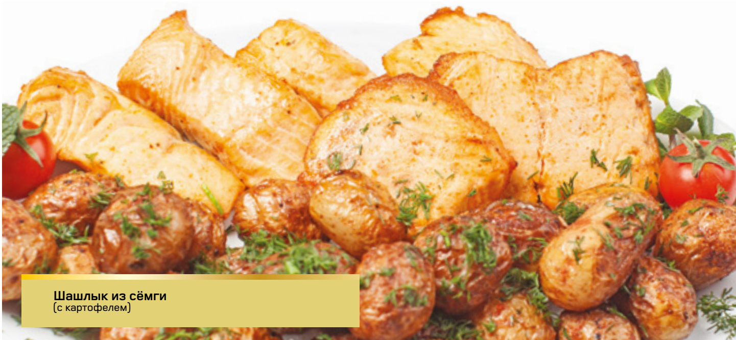
Шашлык из сёмги (с картофелем)