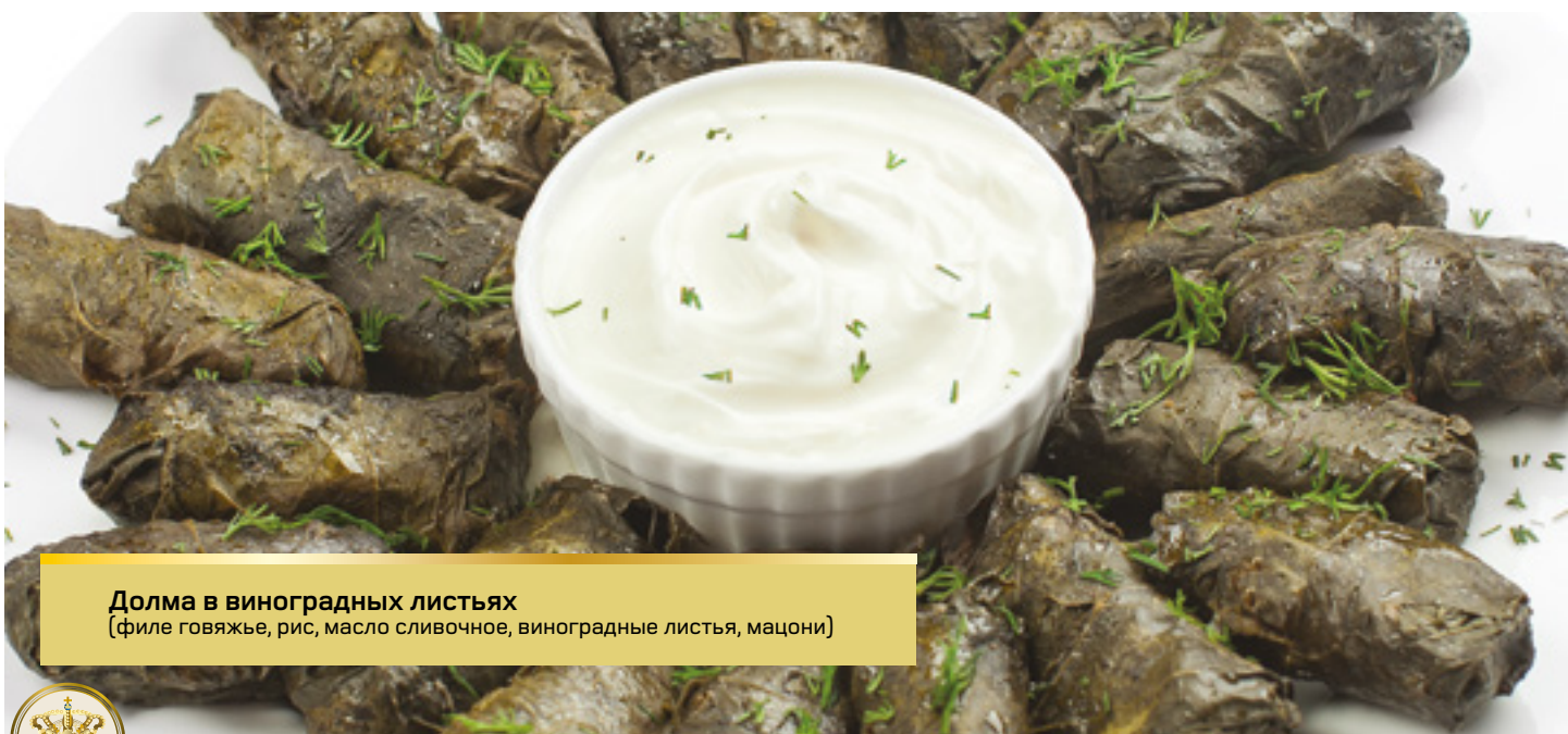
Долма в виноградных листьях (филе говьяжье, рис, масло сливочное, виноградные листья, мацони)