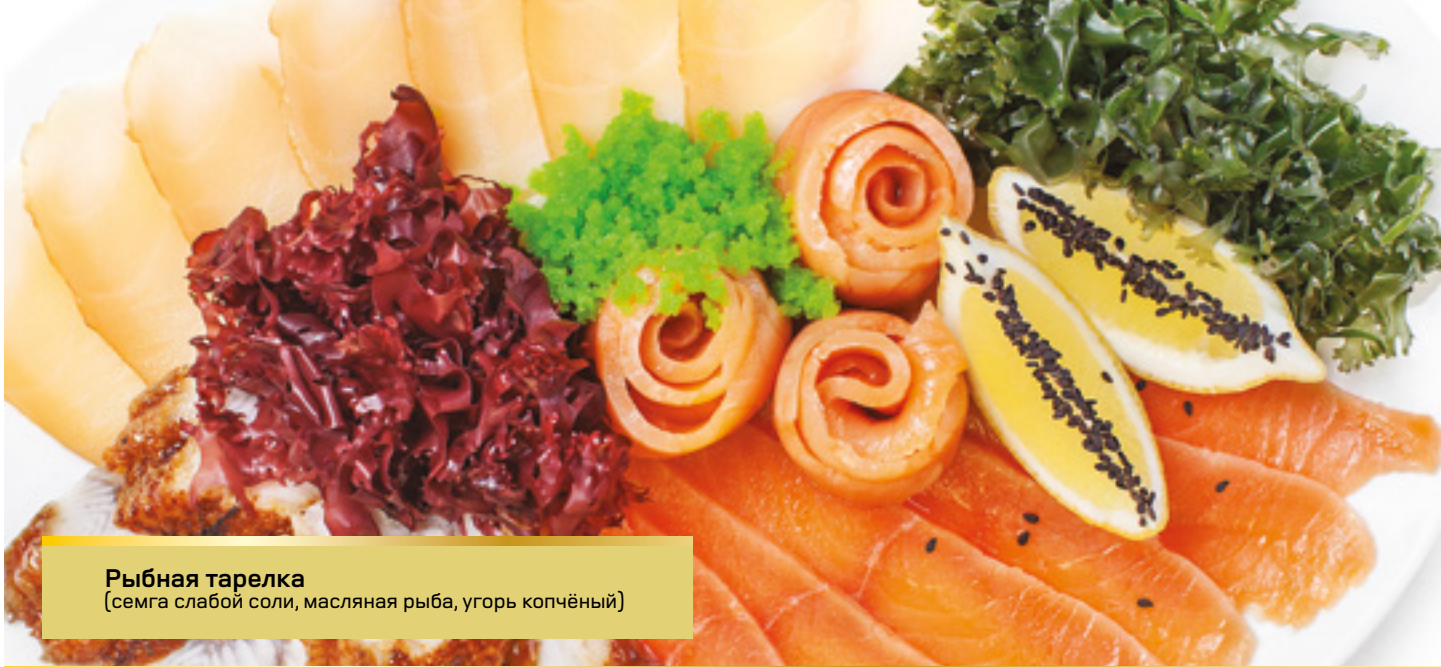
Рыбная тарелка (семга слабой соли, масляная рыба, угорь копчёный)