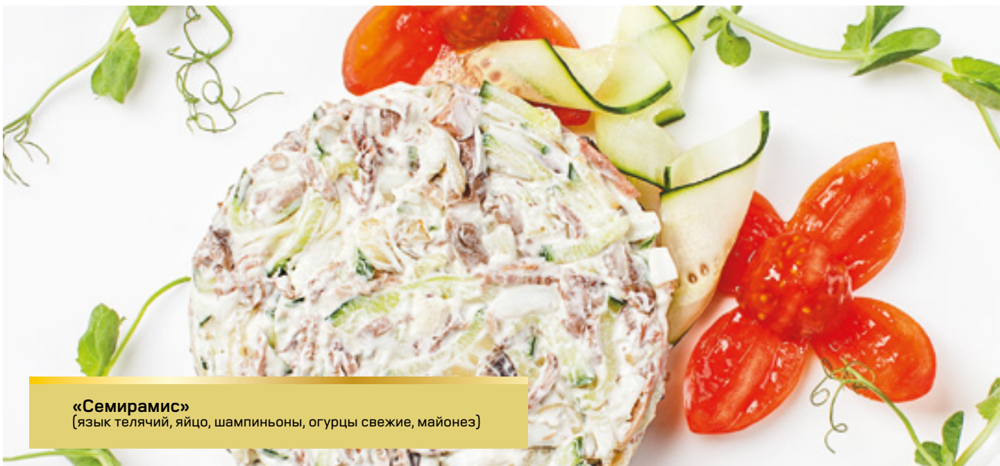
«Семирамис» (язык телячий, яйцо, шампиньоны, огурцы свежие, майонез)