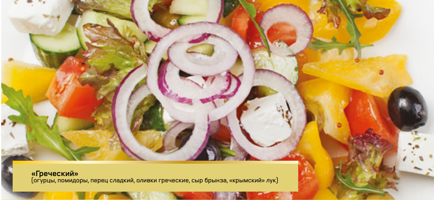
«Греческий» (огурцы, помидоры, перец сладкий, оливки греческие, сыр брынза, «крымский» лук)