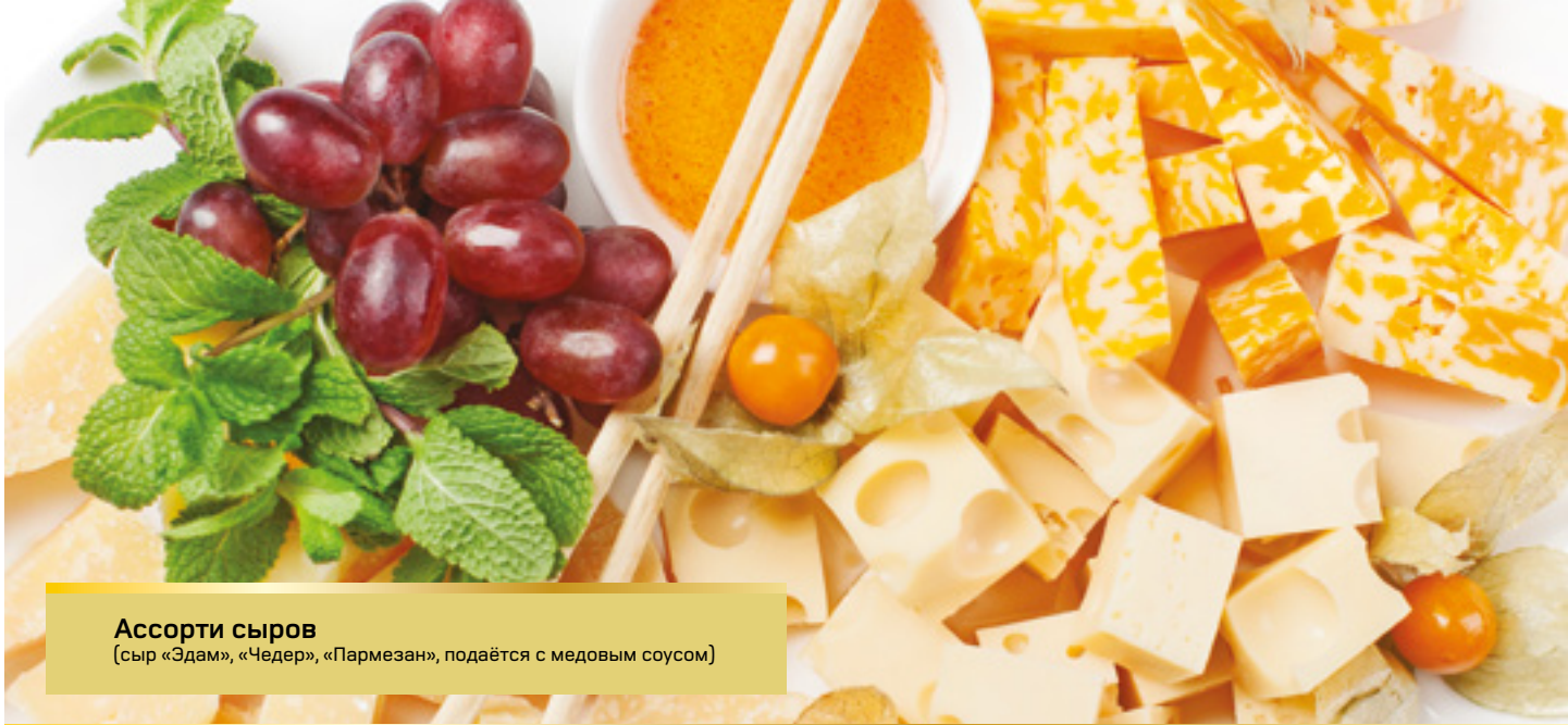
Ассорти сыров (сыр «Эдам», «Чедер», «Пармезан», подаётся с медовым соусом)