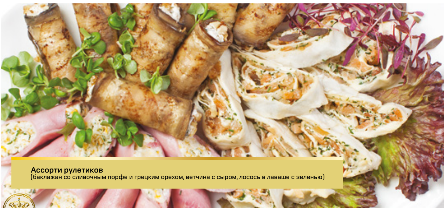
Ассорти рулетиков (баклажан со сливочным порфе и грецким орехом, ветчина с сыром, лосось в лаваше с зеленью)