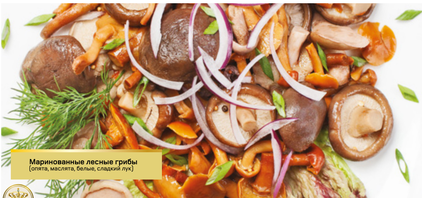
Маринованные лесные грибы (опята, маслята, белые, сладкий лук)