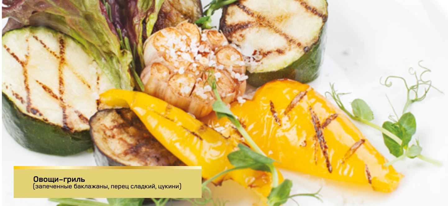
Овощи-гриль (запеченные баклажаны, перец сладкий, цукини)