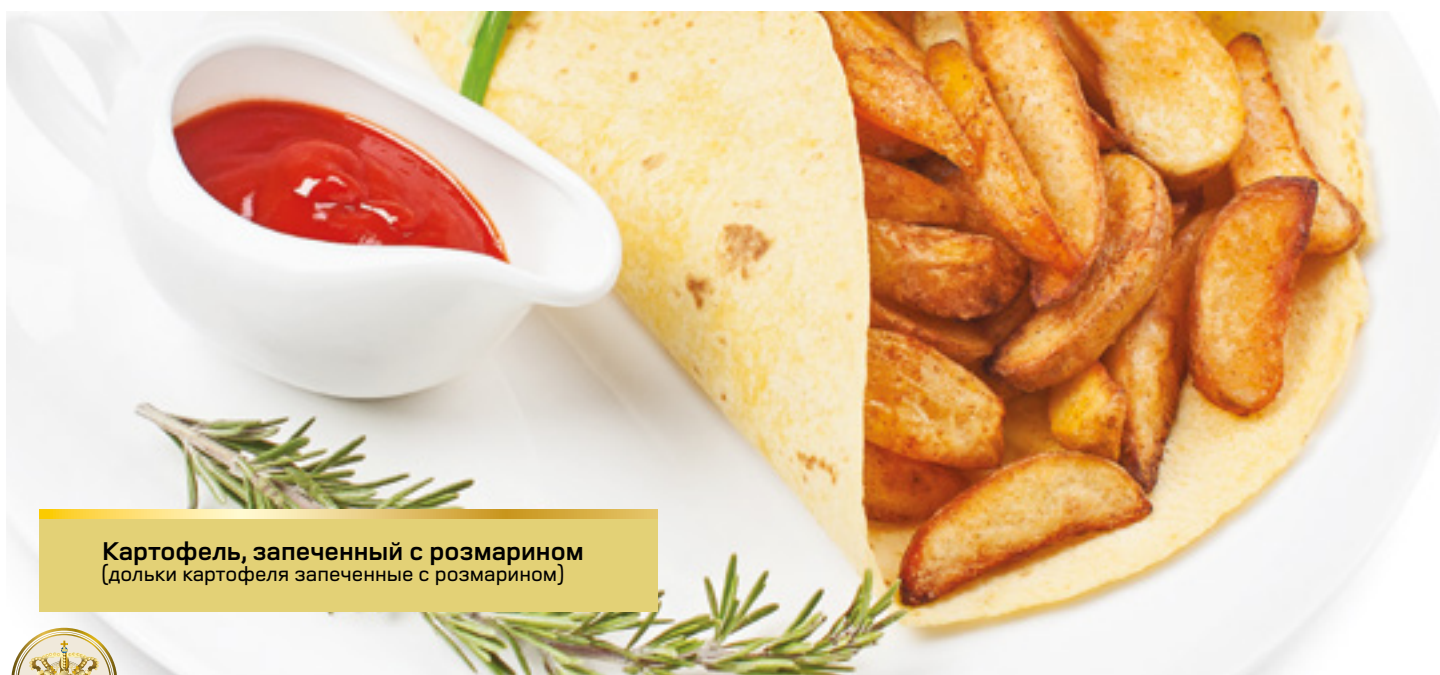
Картофель, запеченный с розмарином (дольки картофеля запеченные с розмарином)