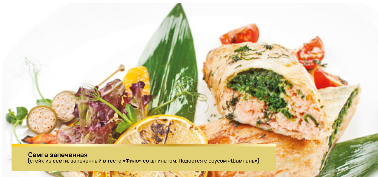
Семга запеченная (стейк из семги, запеченный в тесте «Фило» со шпинатом. Подается с соусом «Шампань»)