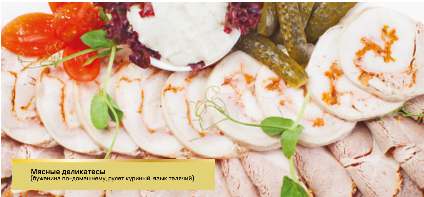
Мясные деликатесы (буженина по-домашнему, рулет куриный, язык телячий)