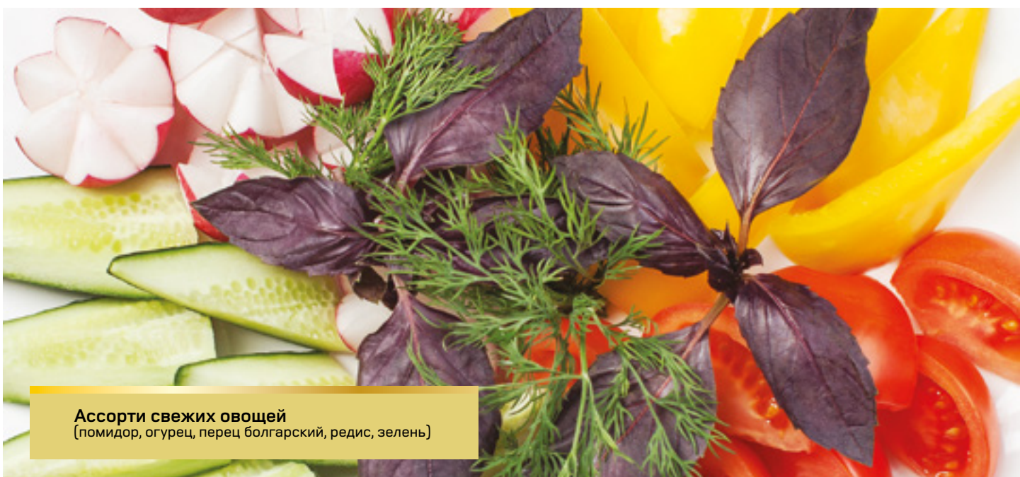
Ассорти свежих овощей (помидор, огурец, перец болгарский, редис, зелень)