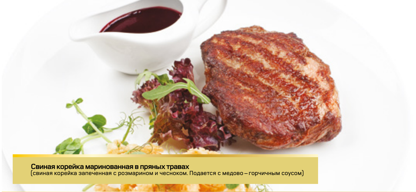
Свинья корейка маринованная в пряных травах (свинья корейка запеченная с розмарином и чесноком. Подается с медово – горчичным соусом)